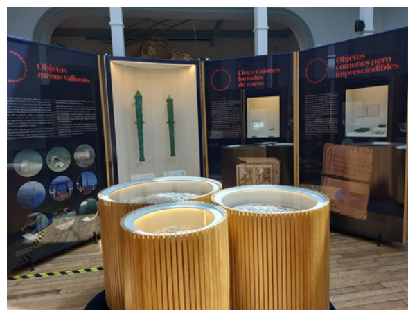
La exposición itinerante Nuestra Señora de las Mercedes. Una historia común en Chile. ©Ministerio de Cultura de España.

Desde que se recuperó el tesoro del barco Mercedes, muchos expertos lo han estudiado y lo están cuidando muy bien. Algunas de las monedas y objetos encontrados se pueden ver en el Museo ARQVA, donde la gente puede aprender más sobre la historia de este barco. También se han hecho exposiciones que viajan a otros países, como una muy especial llamada Nuestra Señora de las Mercedes. Una historia en común, que incluso se mostró en Chile. Estas exposiciones ayudan a que niños y adultos conozcan mejor la historia compartida entre España y América Latina, y muestran lo importante que es cuidar los tesoros escondidos en el mar .