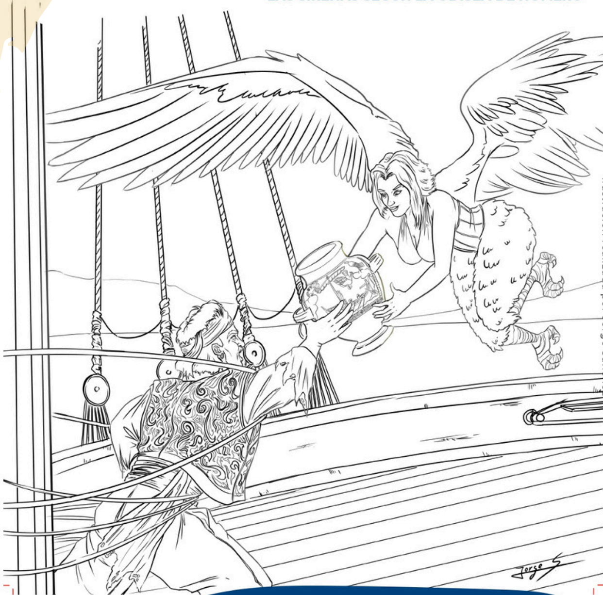
Ilustración realizada por Jorge Sánchez

Odiseo se libera de las ataduras de un barco pirata influenciado por el canto de la sirena Telxepia para entregarle un ánfora que ha sido robada, simbolizando la protección del patrimonio subacuático. Destaca la importancia de preservar nuestro legado cultural sumergido.