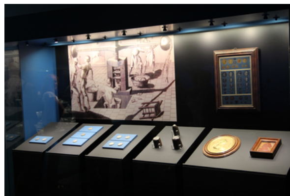
Objetos expuestos en la exposición El Último Viaje de la Fragata Mercedes en el MAN.

Después de recuperar el tesoro del barco Nuestra Señora de las Mercedes, el Ministerio de Cultura y otros expertos hicieron varias expediciones entre 2015 y 2016. Usaron robots para bajar a más de 1.100 metros de profundidad y ver cómo estaba el barco. Allí recuperaron objetos como cañones de bronce y vajillas, que ayudan a conocer mejor cómo era la vida en el barco hace más de 200 años.