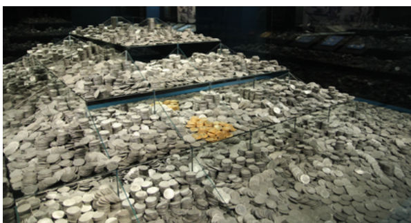
Monedas en la exposición El Último Viaje de la Fragata Mercedes en el MAN.

También encontraron platos de plata, candelabros, una especie de mortero de oro y utensilios de cocina. Todo eso ayuda a entender cómo vivían las personas en los barcos hace mucho tiempo.