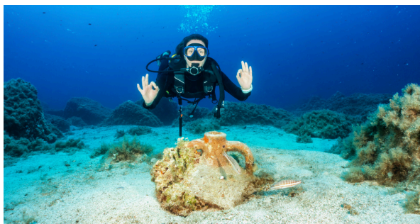
Buceadora con ánfora.

Con estas pequeñas acciones, todos podemos ayudar a proteger los tesoros del mar y asegurarnos de que las futuras generaciones también puedan conocer estas increíbles historias.