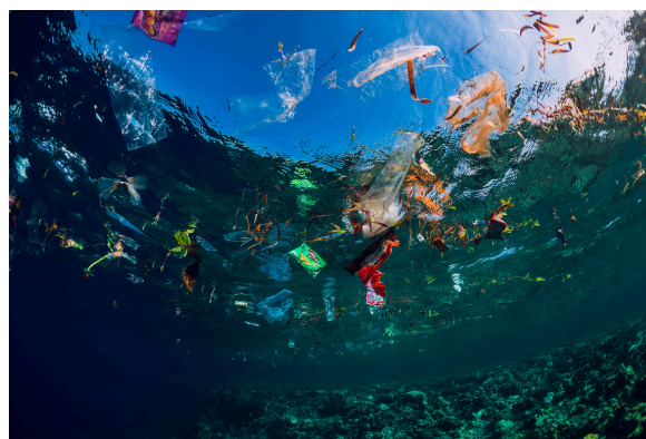
Contaminación por plásticos.

La fideuà no es solo un plato delicioso, ¡es parte de la historia y la tradición de la Comunidad Valenciana! Nació en el mar, gracias a los pescadores , y con el tiempo se ha convertido en una comida muy especial. Su sabor único y la forma en que se puede preparar de distintas maneras la han hecho famosa en muchos países. Hoy en día, la fideuà sigue siendo un tesoro de la cocina valenciana , reuniendo a familias y amigos alrededor de la mesa. Además, nos recuerda lo importante que es el mar y la pesca para la cultura de esta región. ¡Cada vez que disfrutamos una fideuà, también estamos celebrando una tradición muy especial!