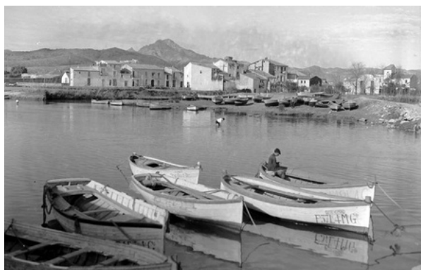
Barcas de pescadores en el puerto de Gandía.

En un barco llamado "Santa Isabel", donde viajaban seis marineros, pasó algo muy curioso a la hora de la comida. El cocinero quería sorprender a todos con una deliciosa paella de mariscos. Para eso, escogió con mucho cuidado gambas, cigalas y un pescado llamado rape. También preparó un caldo especial hirviendo otros pescaditos pequeños para darle mucho sabor.