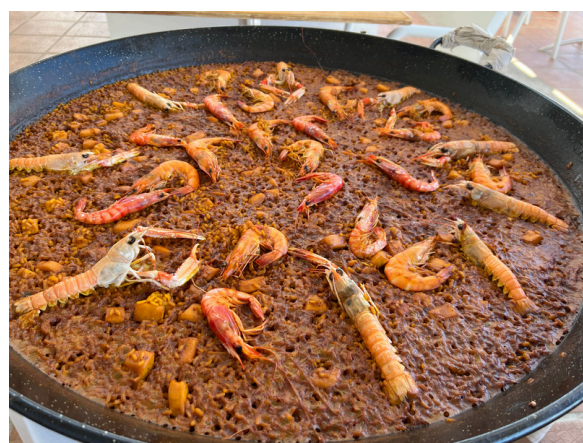
Fideuà valenciana.