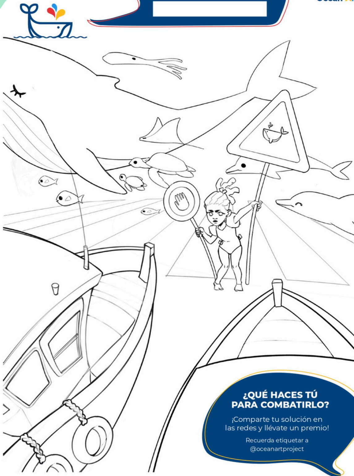
Ilustración realizada por Malú Mosca